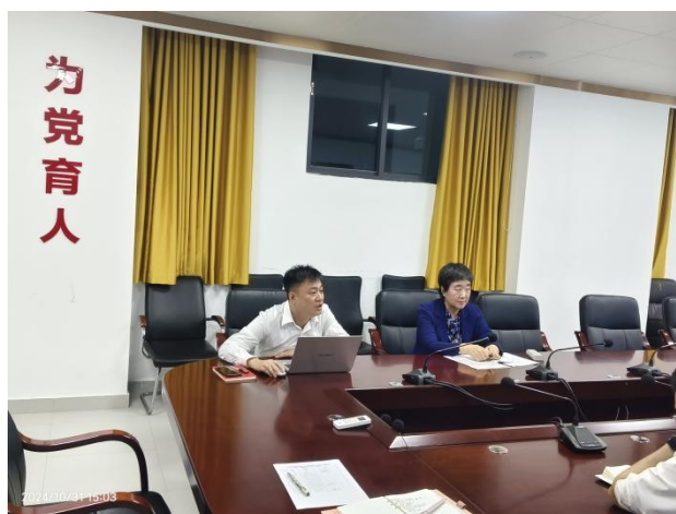
校级督导老师代表发言

构与格式不统一；三是摘要部分不规范；四是在语言表达方面，存在语言表达不规范的问题，存在口语化现象。