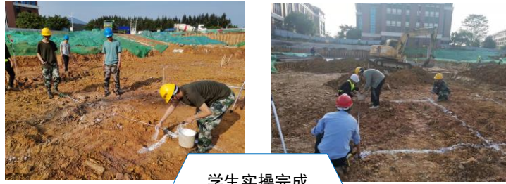
学生实操完成 实训任务