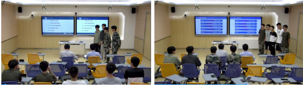
△学生回答指导教师的提问