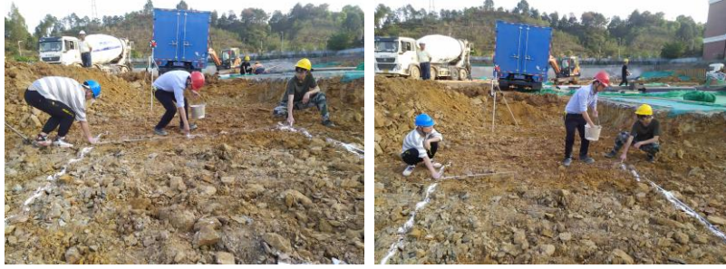
△指导教师操作演示