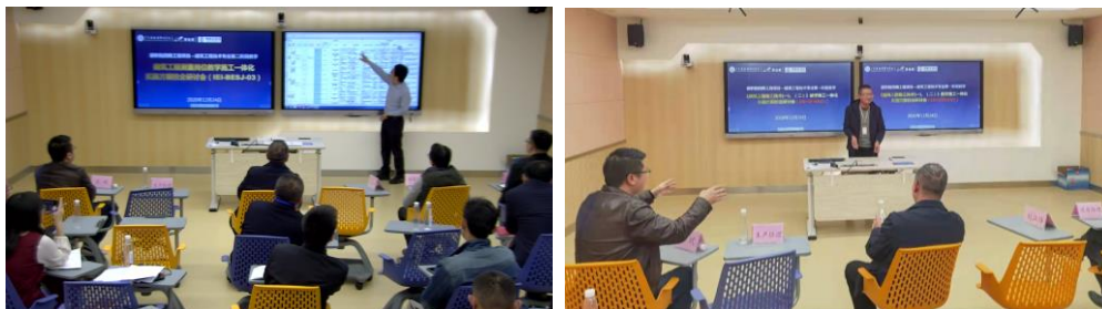
△校企研讨教学施工一体化实施方案

终确定第二阶段岗位技能强化训练教学施工一体化实施方案，并由智能建造工程系系主任和碧职院四期工程项目项目经理、技术总工进行现场签确，为教学施工一体化岗位技能强化训练实施奠定了基础。