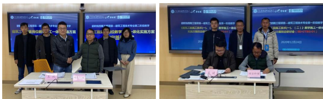
△教学施工一体化实施方案签署仪式