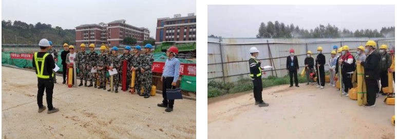
△班前技术、安全交底

1. 进入施工现场由施工技术人员进行班前技术、安全交底，任务布置。根据任务特点对学生进行分组，学生以小组为单位开展强化训练，完成实训任务，培养学生的团队合作精神和组织协调能力。