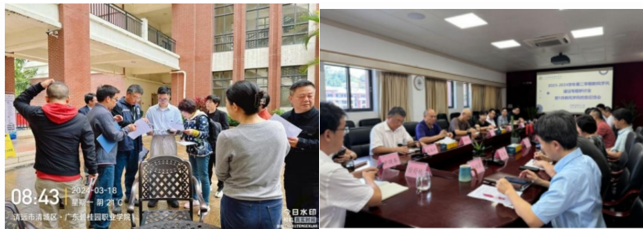
图 7-12 校系（部）两级督导对学生迟到情况抽查现场及学风教风反馈会