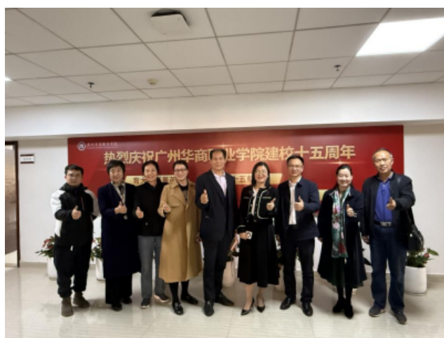
广东碧桂园职业学院赴广州华商职业学院调研