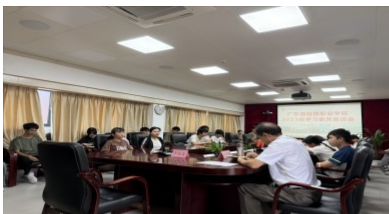
学习委员们积极发言

会上，学习委员们积极发言，反馈了学习与生活过程中遇到的问题：在设备与食堂方面，支出存在损坏或不足的情况；期望更加重视实践操作；课程安排等教学管理方面提出了相关建议；加强学风建设；环境设施存在的不足；食堂饭菜质量和卫生问题指出了相关问题等。