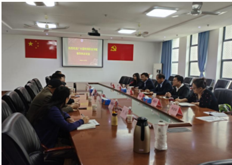
会议室双方交流现场