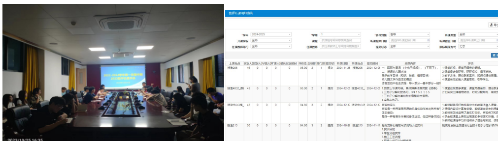
图 7-8 本学年度第一学期学生代表教学质量反馈座谈以及督导听课评价结果明细

通过这一举措，学校教学质量取得了明显成效。一方面，教师们的教学积极性和责任心得到了明显提升，老师们不断改进教学方法，提高授课质量；另一方面，学生们学习效果也得到了显著的改善，对教师的教学质量满意度不断提高，平均满意度达到 95.48%。