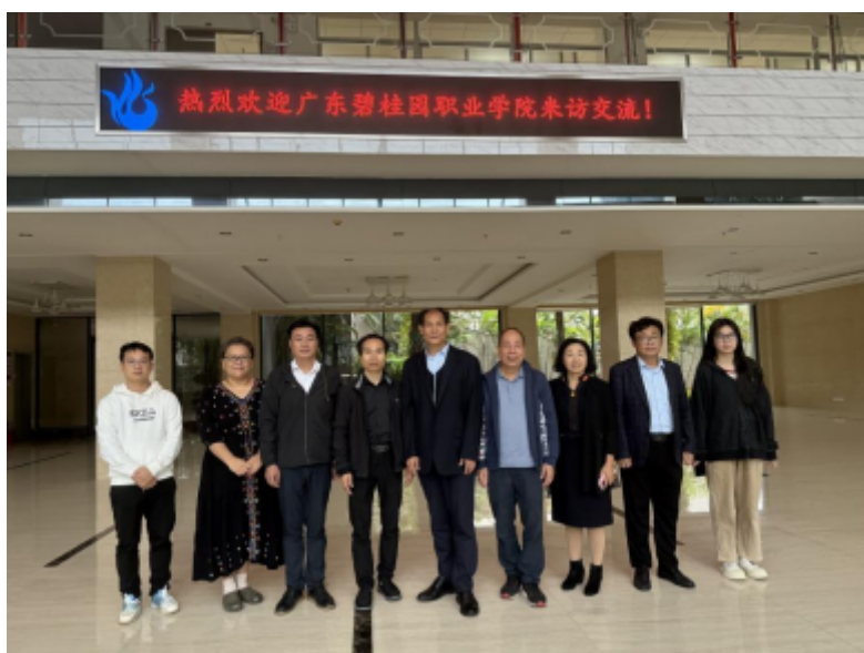
学校督导与广州城建职业学院规划与质量管理办公室人员合影留念

此次调研活动不仅加深了广东碧桂园职业学院与广州华夏职业学院、广州城建职业学院之间的友谊与合作，更为我校开展相关工作提供了重要的参考和借鉴。未来，学校将继续秉持开放合作的理念，积极学习借鉴兄弟院校的成功经验，共同推动职业教育事业的蓬勃发展。